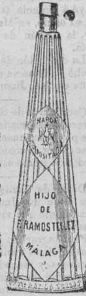
Modelo depositado de la botella de esta casa