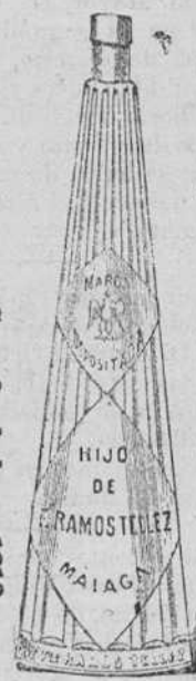
Modelo depositado de la botella de esta casa