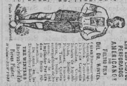
DE LOS EMPLASTOS PERFORADOS AMERICANOS DE HELLING

EMPLASTOS PERFORADOS AMERICANOS DE HELLING ROJO DEL DR. WINTER Los emplastos perforados americanos de Helling, por ser eléctricos, actúan directamente sobre la vitalidad de la parte afectada, y á su vez, ejercen una influencia benéfica sobre el sistema nervioso, produciendo un efecto calmante y anestésico. Los emplastos perforados americanos de Helling, por ser eléctricos, actúan directamente sobre la vitalidad de la parte afectada, y á su vez, ejercen una influencia benéfica sobre el sistema nervioso, produciendo un efecto calmante y anestésico. Los emplastos perforados americanos de Helling, por ser eléctricos, actúan directamente sobre la vitalidad de la parte afectada, y á su vez, ejercen una influencia benéfica sobre el sistema nervioso, produciendo un efecto calmante y anestésico.