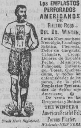
Los EMLASTOS PERFORADOS AMERICANOS DEL FIELTRO ROJO DEL DR. WINTER.

Los EMLASTOS perforados americanos de fieltro rojo del Dr. WINTER, infunden una saludable corriente eléctrica por todo el sistema, é instantáneamente mitigan los dolores, tranquilizan los nervios, fortalecen los órganos digestivos debilitados y devuelven á los enfermos la salud sin ninguna fé y á menudo á pesar de los temores y las preocupaciones. Estos Emplastos son especialmente útiles para fortalecer los delicados músculos dorsales de las señoras en sus periodos mensuales. Todas las escuelas de Medicina los recomiendan y usan para las curas de las afecciones neurálgicas, reumatismos, debilidades causadas por indiscreciones anticipadas esfuerzos indebidos ó enfermedades de los riñones, pleuresias, calambres, punzadas en la espalda, dolores en el pecho que se extienden á los homoplatos y finalmente para todas las enfermedades que resultan de interrupciones en la circulación.