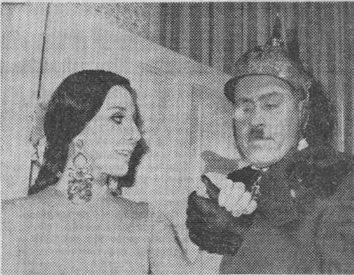
Película en rodaje. Película con Gracita Morales y José Luis López Vázquez de protagonista. El título nos lleva fácilmente al argumento, porque el film se titula «La verdadera historia de Mata-Hari». Más o menos, la cosa viene a ser una mesa de James Bond, pero a base de «belle époque»... y con la risa asegurada por partida doble.