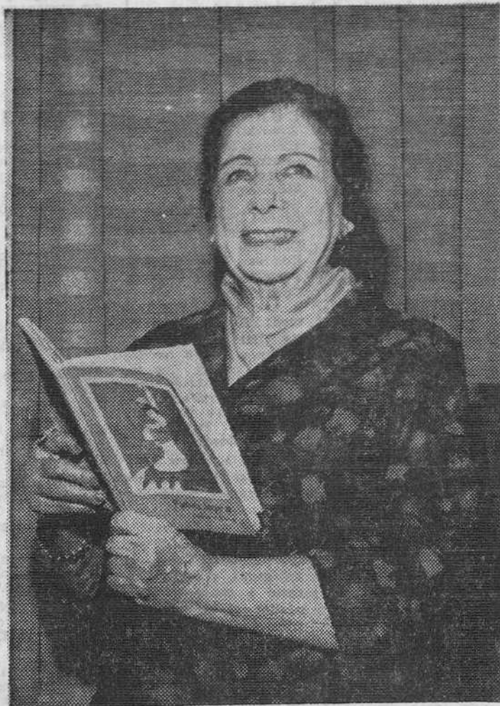
A Pastora Rojas Monge «Pastora Imperio» para el mundo artístico, no le pesa el tiempo. La artista de hace años es hoy una abuela simpática y dichosa, que vive feliz rodeada de nietos y biznietos.