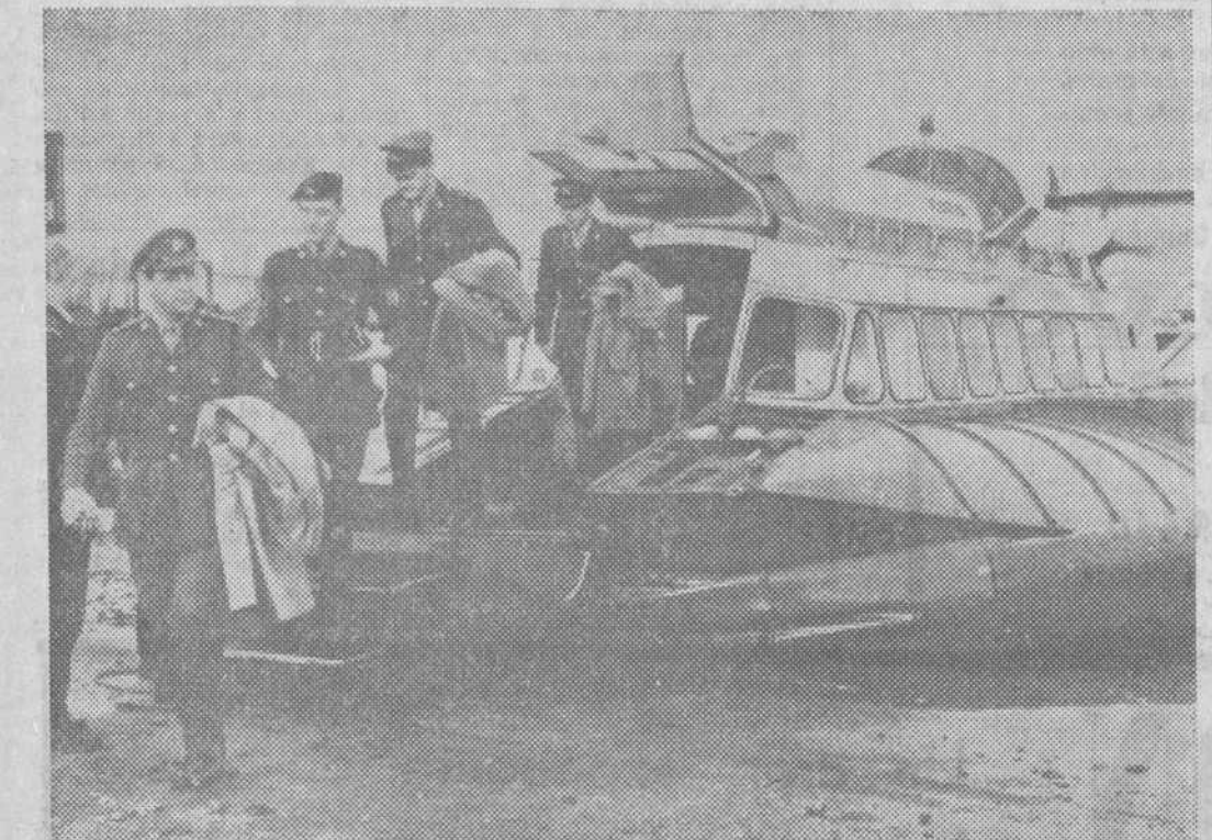
Isia de Wight (Sur de Inglaterra). — Personal del mando de transporte de las fuerzas armadas de la Gran Bretaña desembarcan de un «Hovercraft SRN-6», construido por la Hoverworks Ltd. Seguirán aquí un curso de adiestramiento que el Ministerio de Defensa ha firmado con la mencionada empresa para que enseñe a oficiales y suboficiales el funcionamiento de los «hovercrafts».

Isa de Wight (Sur de Inglaterra). — Personal del mando de transporte de las fuerzas armadas de la Gran Bretaña desembarcan de un «Hovercraft SRN-6», construido por la Hoverworks Ltd. Seguirán aquí un curso de adiestramiento que el Ministerio de Defensa ha firmado con la mencionada empresa para que enseñe a oficiales y suboficiales el funcionamiento de los «hovercrafts».