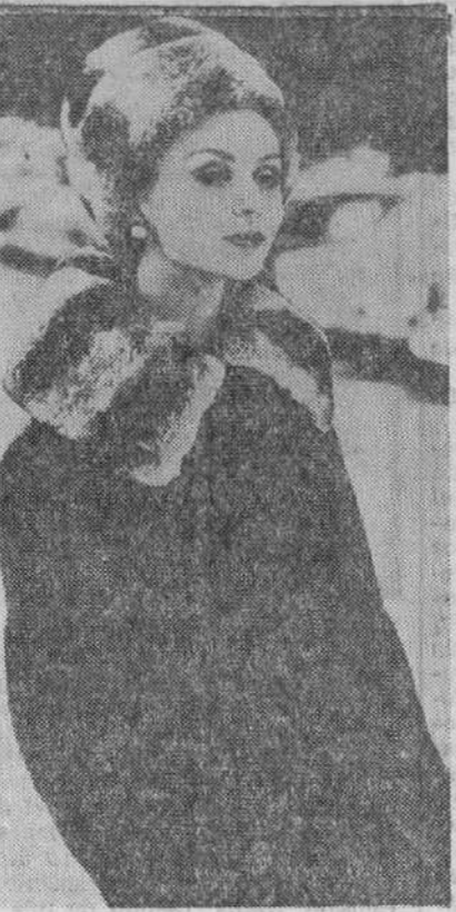
Este modelo de traje de chaqueta en tweed marrón y negro, con piel de chinchilla en cuello y turbante, causó sensación en París. Se llama «Women».

Todo esto no debe impacientarnos a las personas mayores que le rodean al contrario es una manifestación de que su vida psíquica se desarrolla al mismo ritmo que la física. Es importante no defraudar continuamente esa curiosidad que abo-