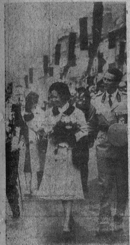
Namur (Bélgica). — Del brazo del Rey Balduino, la Reina Fabiola responde a las aclamaciones de la multitud, a la llegada de los soberanos a esta ciudad, que visitaron juntos por primera vez.