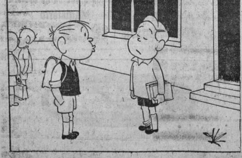
—Casi ocho meses de clase y menos de cinco de vacaciones; no es justo.