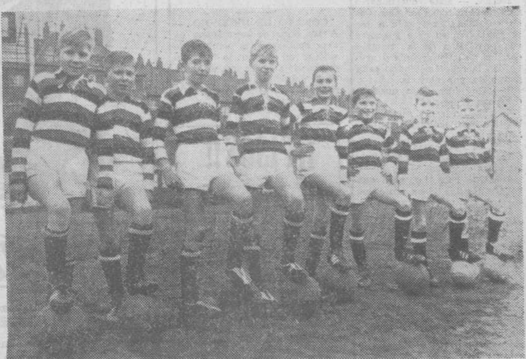
El «Altona» es un equipo de fútbol infantil de la ciudad alemana de Hamburgo, que está compuesto en su mayor parte por varias parejas de mellizos. En la fotografía vemos a ocho de ellos, que suponen causarán dificultades al árbitro.