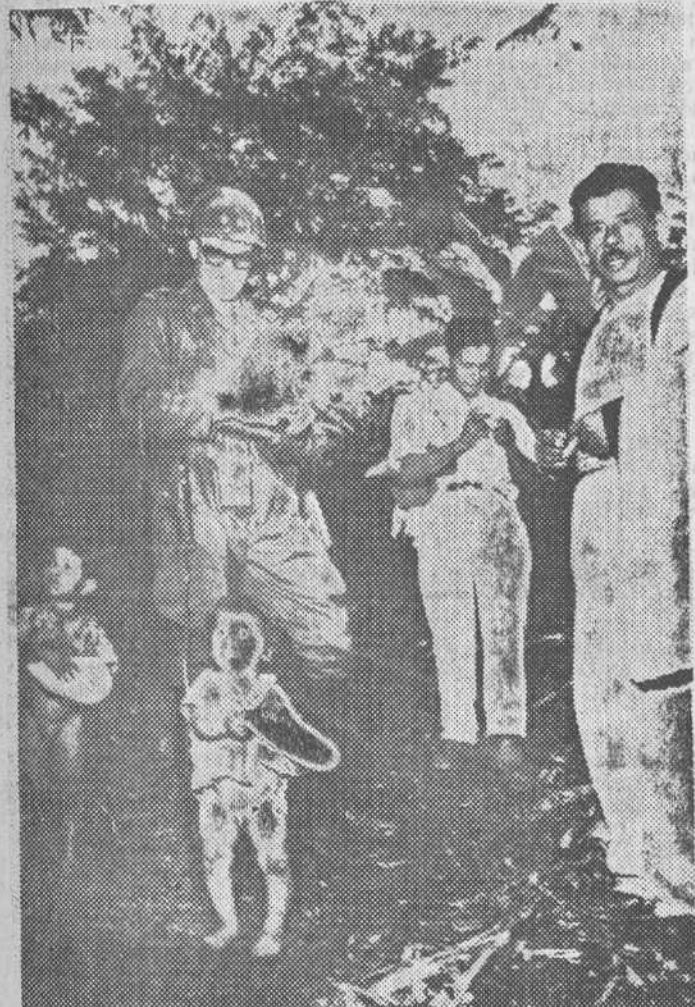
Dos niños abandonados en la jungla colombiana imploran la caridad de las tropas gubernamentales. Casos como éste son corrientes en todo el país.

Se calcula que más de cien mil trabajadoras acuden desde los suburbios a trabajar en el centro de Río. Ahora, muchas de ellas encuentran muy problemático encontrar restaurantes decentes en los que haya plaza libre. El salario de una secretaria es de unos 150.000 cruzeiros al mes, unas 4.200 pesetas. En un restaurante de segunda clase, un menú equilibrado le cuesta aproximadamente 1.800 cruzeiros. «Ya que no podemos asistir debidamente a todas las solteras con hijos, los ofrecemos esta posibilidad de que no abandonen su trabajo, pero nuestro fin principal es ayudar a las jóvenes y orientarlas espiritualmente para el matrimonio, el tienen vocación por ese estado».