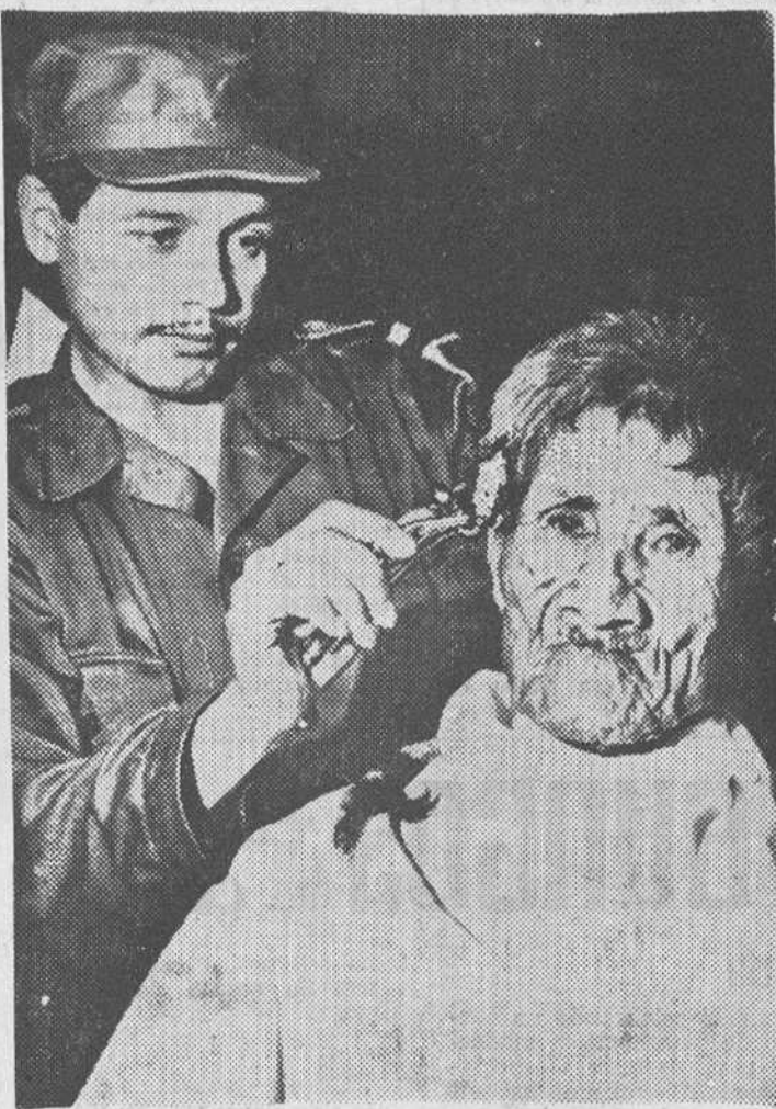
Un soldado deja por un momento las armas para "peluquear" civiles, como se dice en Colombia. — El rostro del anciano cliente semeja el de una momia.

"Fuimos cogidos como rehenes. Nos obligaron a dejar todo o que poseíamos. Sólo nos permitieron llevar unas pocas vituallas... El primer día ya quedamos espantados por la ferocidad de nuestros guardianes. Una anciana que había sido obligada también a seguir el éxodo no pudo más y se arrojó al suelo. Llorando pidió que le dejaran deshacer el camino. De un solo golpe le abrieron la cabeza con un machete. Durante un alto, en la noche, una mujer dio a luz. Dotada de una energía extraordinaria, a la mañana siguiente reemprendió la marcha con su niño entre los brazos... Al cabo de pocos días ya no quedaban provisiones. Dos mujeres más dieron a luz. Los niños murieron de fatiga y de hambre. Dos viejos fueron asesinados, porque no podían más. Por fin, una noche, yo conseguí escaparme".