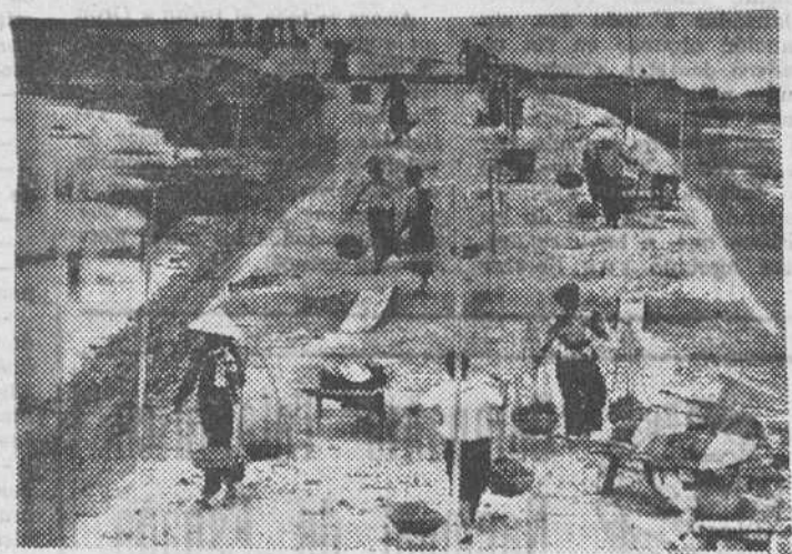
Durante su aventura, el periodista japonés Okamura captó la imagen de mujeres vietnamitas construyendo diques y carreteras en la retaguardia del Vietcong.

EN el Vietnam, los periodistas norteamericanos solo pueden ver la guerra desde un lado: el de los gubernamentales. Ahora bien, un fotógrafo de Prensa Japonesa decidió un buen día pasarse al otro lado y ver la guerra del lado del Vietcong. Contaba con dos ventajas: su piel era amarilla como la de los vietnamitas y se llamaba Akihiko Okamura.