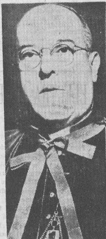
El Cardenal de Río de Janeiro, Su Eminencia Jaime de Barros Câmara.

El Cardenal de Río de Janeiro, S. E. Jaime de Barros Câmara, apoya con entusiasmo esa idea de crear restaurantes reservados a las jóvenes trabajadoras, siguiendo el ejemplo dado ya por otros países. UN REGIMEN DE GARANTIA Según el plan de las Hijas de María, dos monjas estarán siempre en los restaurantes y en ellos se rezará antes y des-