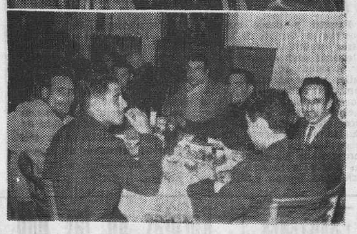
Grupo de asistentes a la comida de confraternización