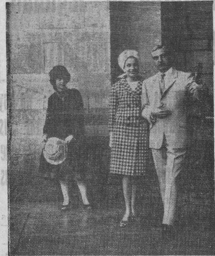
La moda masculina española ofrece esta peculiaridad: que va perfectamente del brazo de una mujer elegante...