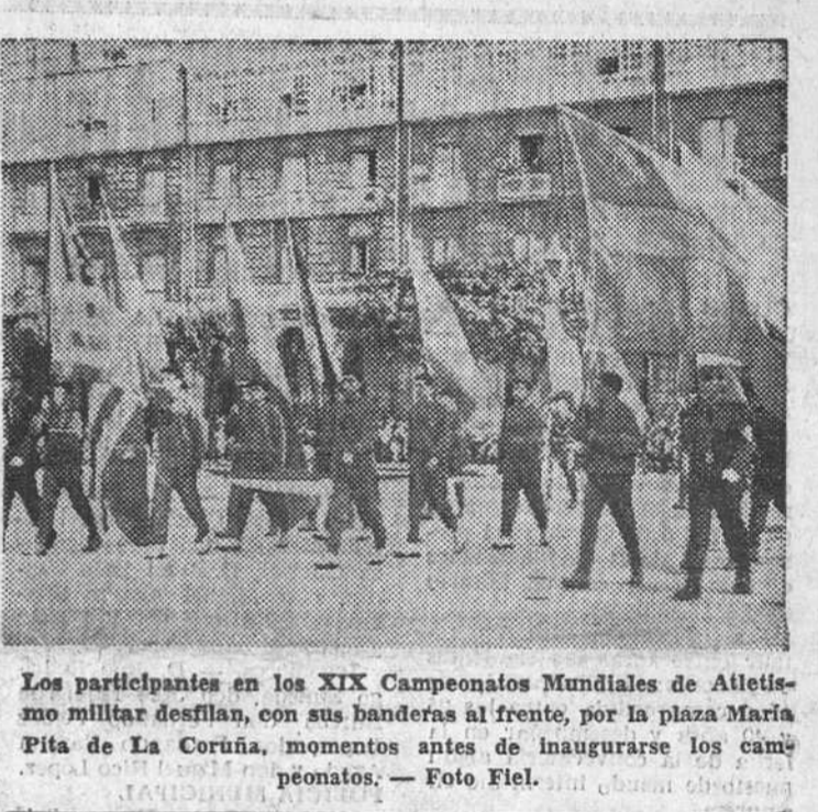
Los participantes en los XIX Campeonatos Mundiales de Atletismo Militar desfilan, con sus banderas al frente, por la plaza María Pita de La Coruña, momentos antes de inaugurarse los campeonatos.