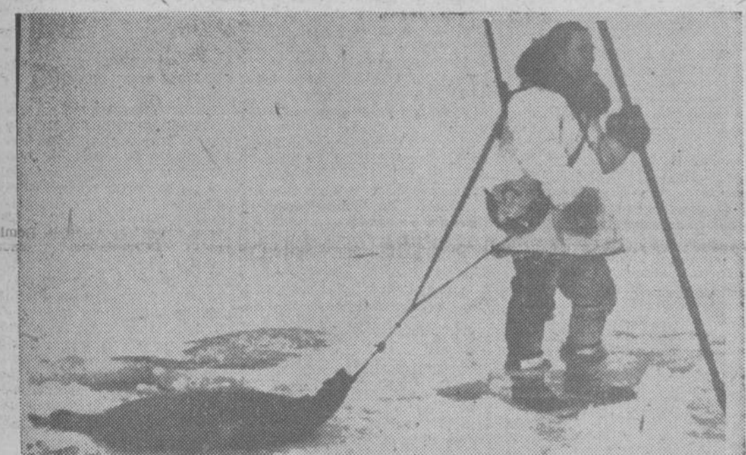
La pesca constituye una de las principales actividades de los esquimales en los ríos que no dejan de conocer el hielo casi todo el año.

Fabricado por V.I.A.S.A. en Zaragoza España BAJO LICENCIA DE LA KAISER JEEP CORP.-WILLYS TOLEDO U.S.A. CONCESIONARIO: JOSE BARRIOS Vitoria, 109 BURGOS