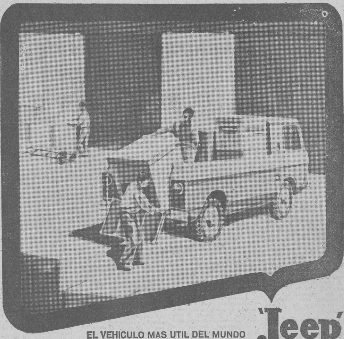
EL VEHICULO MAS UTIL DEL MUNDO

Fuera del avión —donde la temperatura se mantiene uniforme en los veintidós grados— hace frío, mucho frío. Treinta, cuarenta bajo cero. Pero en cambio la visibilidad es imponente. Durante bastante tiempo podrá usted admirar desde la ventanilla del avión el cao urbano de Anchorage, encrucijada aérea entre dos continentes y a la que la aviación le forzó a un colosal desarrollo y crecimiento, tronchado hoy por desgracia al temblar la Tierra en aquellas lejanas latitudes.