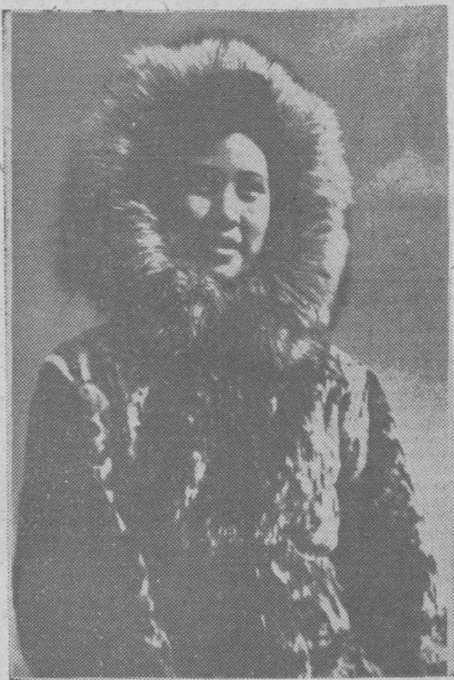
Bella joven esquimal, enfundada en gruesas pieles

Los zares soñaban sólo con extender su dominio por toda California, tomando como base a Alaska y los Estados Unidos hubieron de salirse al paso cortándoles las ansias de