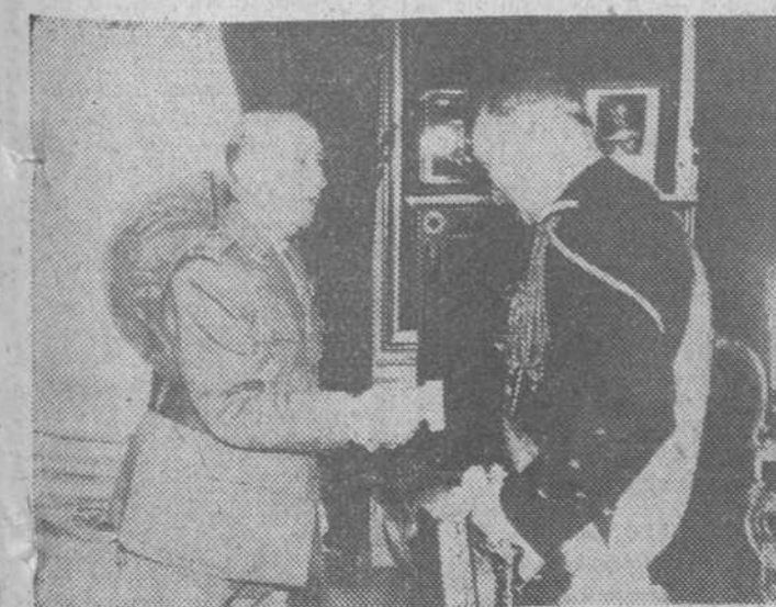
El Jefe del Estado es, aho!, Generalísimo Franco, saluda al jefe del Estado Mayor de la Marina francesa, almirante Cabanier, durante la visita que éste le hizo al palacio de El Pardo, en el curso de su visita a España.