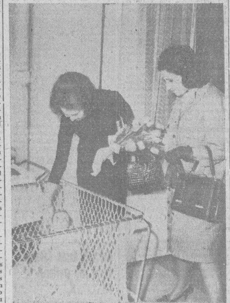
Madrid.—La Princesa Sofía de Grecia y la hija de Su Excelencia el Jefe del Estado, marquesa de Villaverde, en un momento de su visita al Hogar-Cuna «Carmen Franco».

Zaragoza.—La realidad ha rebasado los más optimistas cálculos en relación con el Polo de desarrollo de Zaragoza. A la hora de cerrar el primer plazo de presentación de solicitudes de los beneficios anunciados, asciende a 157 las empresas que han presentado instancias para la creación de nuevas factorías o ampliación de empresas en terrenos del Polo. Los presupuestos de inversión suponen una cantidad global de 7.523 millones de pesetas, así como la creación de 14.260 nuevos puestos de trabajo. No es menos interesante decir que empresas muy importantes, que no han tenido tiempo para ultimar sus proyectos para este primer plazo, han anunciado la presentación de solicitudes para el segundo, es decir, antes del 15 de Julio próximo. Los dos capítulos de industrias más importantes, a la vista de las solicitudes presentadas, son las de metalurgia y alimentación.