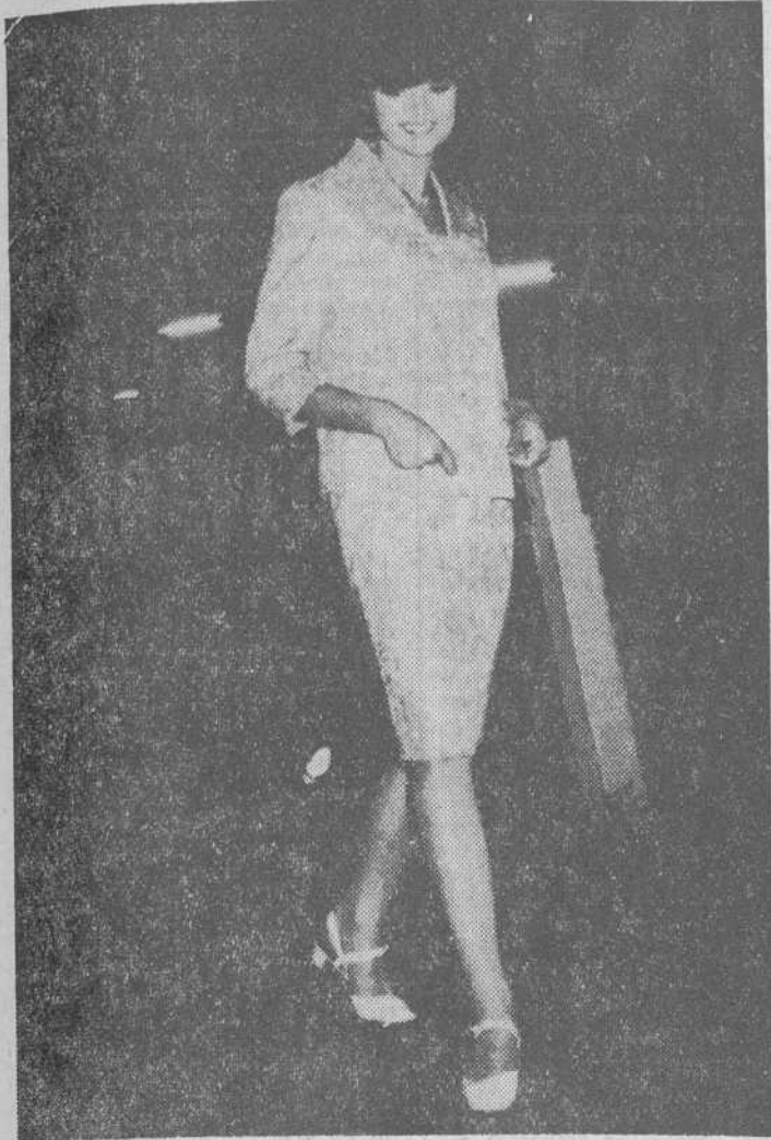
La señorita Merche luciendo un juvenil traje de verano

Patrocinada por el Excmo. Ayuntamiento, fue organizada por la firma burgalesa "CAMPO" con exhibición de modelos "CORTEFIEL" y trajes de baño "OSIRIS"