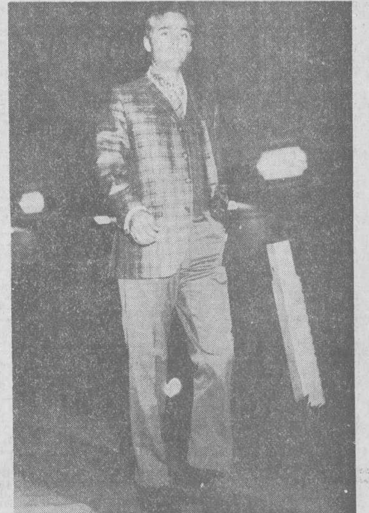
El Sr. Díaz, en pase con un conjunto «sport» de verano

tando los ramos de flores con que la firma CAMPO había obsequiado. Establecimientos CAMPO han dado un ejemplo más de su interés por Burgos. La Gran Gala del Vestido, en su dos mani-