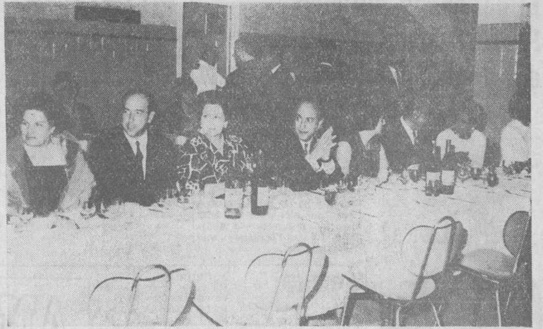
VISTA PARCIAL DE LAS AUTORIDADES QUE PRESIDIERON EL ACTO

ocurren muchas cosas. Por ejemplo, que si CAMPO Y CYLSA les depositan su confianza es por algo. O que el público consumidor sabe tanto como nosotros. En fin, también se nos ocurre que no conduce a ninguna parte ponderar lo que no necesita ponderación porque todo el mundo la acepta. Pero no queremos dejar de reseñar una anécdota que lo rubrica todo. Es esta: