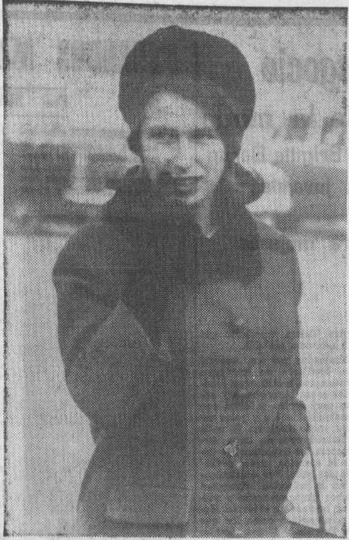
La Princesa Ana de Inglaterra ya no es la niña que hasta ahora hemos visto en las fotografías de las revistas y periódicos. Ana es ya una mujer.

La Inglaterra deportiva aplaude su gusto por el riesgo y la filosofía con que acepta los accidentes.