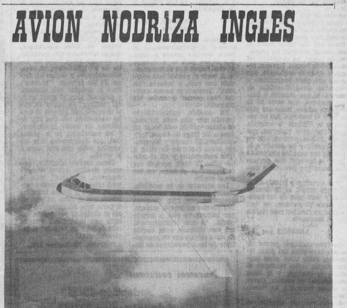
Los fabricantes británicos de aviones están estudiando este diseño de «Jet» suministrador, es decir, «avión nodriza». Se trata de un aparato que puede aterrizar en terreno sin preparar

Mas el frío, cuando no nos amenaza con ese rigor, logra cambiar los hábitos de un pueblo. En general, tiende a hacernos menos comunicativos, nos fuerza a encerrarnos en nuestros hogares o nos empuja a ciertos establecimientos públicos como los cines o los cafés, en donde es posible la convivencia social. El verano, en cambio, es época de expansión, de franqueza. Se entablan durante el verano relaciones sentimentales que serían inconcebibles en un ambiente térmicamente frío. Esto explica que algunas enfermedades debidas a virus se propaguen con gran facilidad en los meses de invierno, en los que un gran número de personas se apretujan en pequeños lugares como queriendo compartir el calor de sus calefacciones. Este es el caso de la grip. y de toda la amplia gama de resfriados. Se ha demostrado, en efecto, que el frío sólo actúa de una manera indirecta en la propagación de estos síndromes tan molestos, aunque por suerte nada graves. Pero aún así, hay muchas personas que prefieren el frío al calor, porque si bien parece ser que la temperatura ideal desde un punto de vista fisiológico es la de 18°, podríamos parodiar el refrán universal diciendo que «en cuestión de gustos termométricos no hay nada escrito».