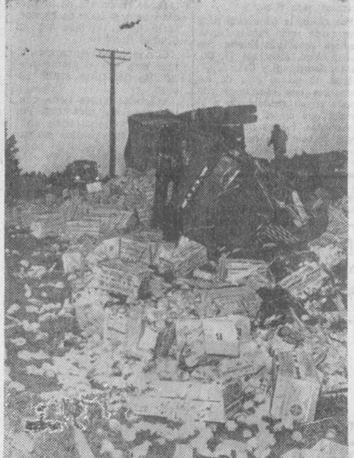
Un hombre muerto y quince toneladas de naranjas esparcidas por el suelo es el resultado de un choque entre dos camiones ocurrido en un carretera del Norte de Jutlandia, cerca de la ciudad de Alborg, en Dinamarca. En la fotografía vemos un aspecto del accidente.