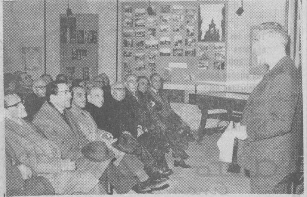
Ayer se inauguró en la histórica Torre de Santa María la exposición «Peregrinos y Caminos de Santiago en Francia y Europa» que presenta la Sociedad de Amigos de Santiago de Compostela en Francia «Centro de Estudios Compostelanos», con el patrocinio del Ayuntamiento de Burgos y la colaboración del Ministerio de Información y Turismo. Ante autoridades y personalidades aparece el conde de la Coste durante su brillante disertación sobre Francia y el Año Santo Compostelano 1965.