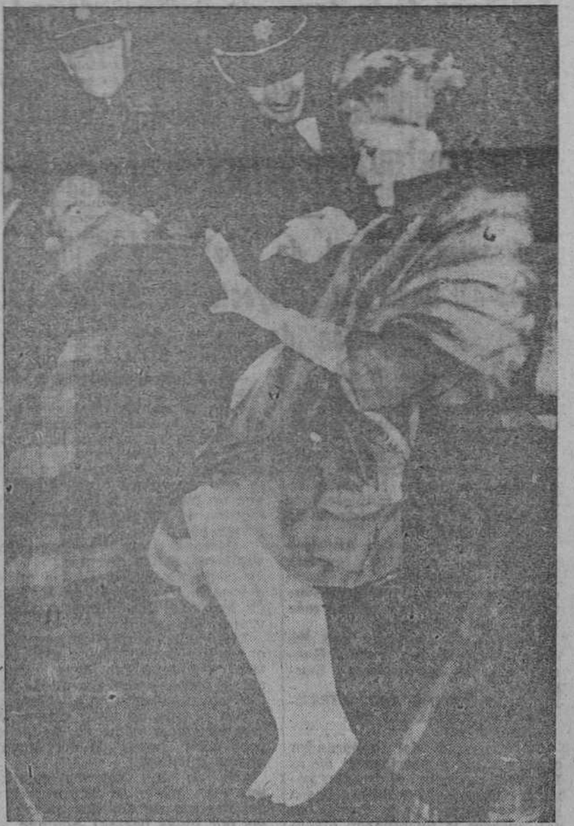
Dublin.—La visita de los Príncipes de Mónaco a Irlanda, donde Grace tiene a sus mayores, se realiza en medio de continuas manifestaciones de cariño por parte del público irlandés. En la foto: los Príncipes durante un acto en el Croke Park de Dublin, tienen que arroparse, a causa del frío.