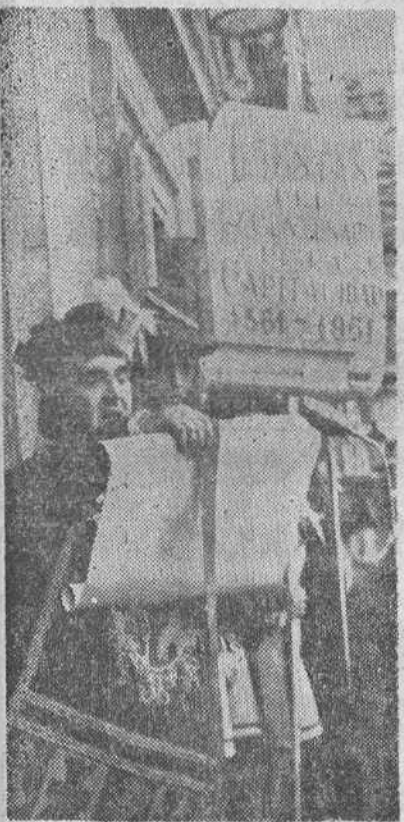
Madrid.—Han comenzado los actos conmemorativos del IV Centenario de la Capitalidad de Madrid. En los balcones de la Casa Consistorial tuvo lugar el Pregón de las Fiestas, y en la Plaza de la Villa actuó el Coro de Danzas del Centro Zamorano, seguido de un desfile del cortejo.