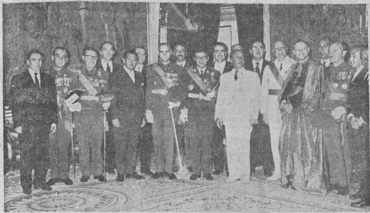
Madrid. — Su Excelencia el Jefe del Estado ha recibido en el Palacio del Pardo a una Comisión de la Junta Nacional de las Hermandades de Alféreces provisionales presidida por el ministro del Ejército. — (Foto Europa Press).