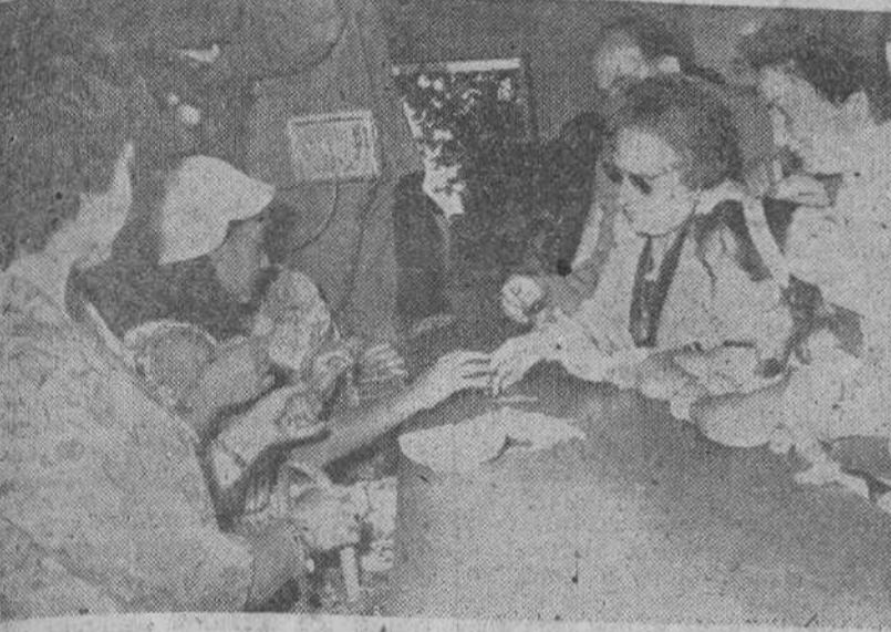
Las nietas del Caudillo acudieron, con su abuela, a la Tómbola diocesana de Caridad. He aquí un momento de su caritativa labor en la expedición de boletos.

Regresan a Miami los ocupantes del avión norteamericano que secuestró Fidel Castro Ha comenzado en Montevideo la primera Conferencia de la Asociación latino-americana de libre comercio