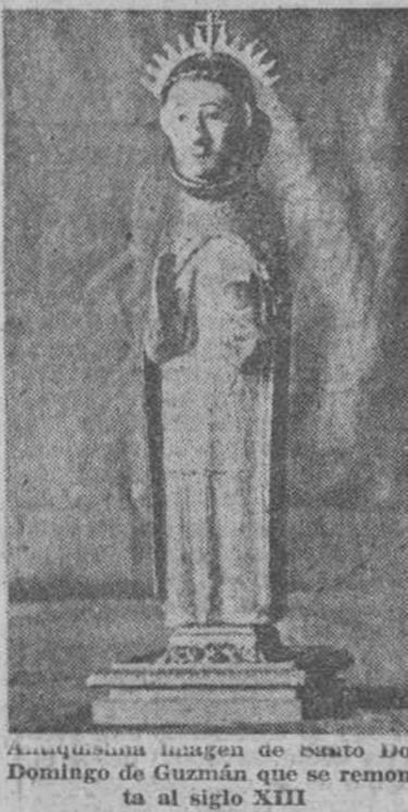
Algunas imágenes de Santo Domingo de Guzmán...