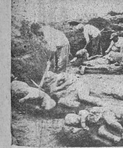
Nápoles (Italia).—La antigua ciudad de Pompeya, en la falda del Vesubio, destruida en el año 79 a causa de una erupción, entrará durante la noche a la ciudad y sus habitantes. Pompeya, la ciudad muerta siempre ha sido una de las más ricas e interesantes en el Mundo entero, bajo el aspecto arqueológico. Las innumerables excavaciones practicadas han constituido una extraordinaria fuente para conocer la pasada civilización. En la foto, trabajadores arqueólogos extraen de su molde de tierra, los fósiles de cinco personas, tres niños y dos adultos, los cuales se hallaban envueltos bajo una gruesa capa de cenizas y lava petrificada desde aquella remotísima época.