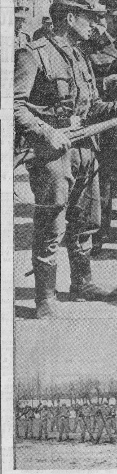
En la mañana de ayer y en las instalaciones de la Ciudad Deportiva Militar, el capitán general de la Región, teniente general Marín de Bernardo, a quien acompañaba el jefe de su Estado Mayor, general Ucar y demás generales con mando en plaza, inspeccionó los Cuadros de instructores de las Unidades y Cuerpos de la guarnición en esta plaza y que han de formar a los nuevos reclutas próximos a incorporarse.

El capitán general de la Región inspecciona los cuadros de instrucción de la Guarnición