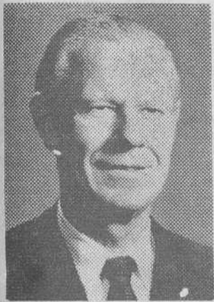
El embajador Davis, asesinado en Nicosia

Elogios turcos a la URSS y USA y ataques a Londres