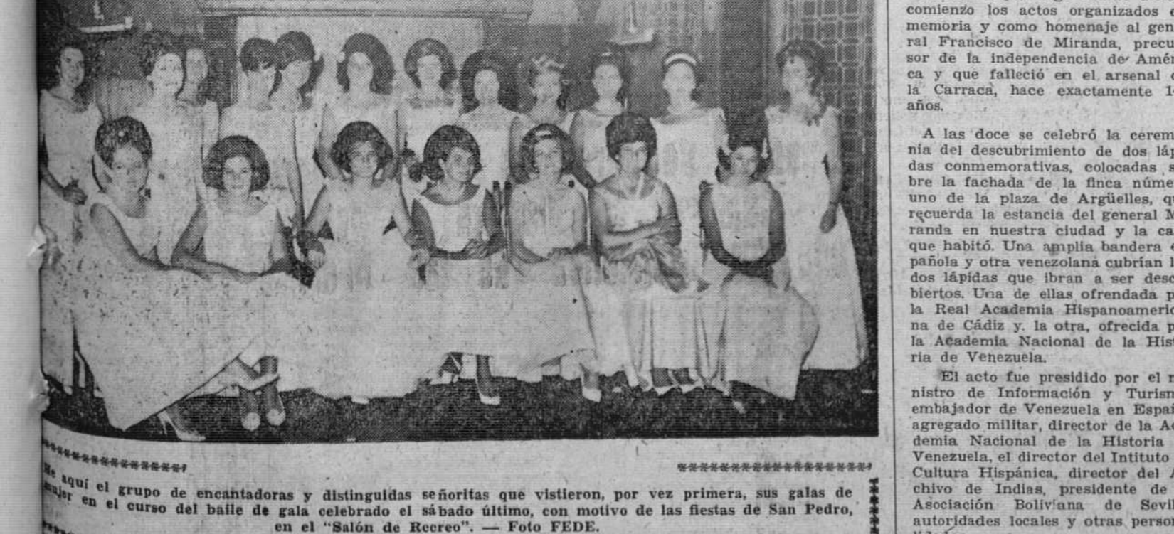
Este aquí el grupo de encantadoras y distinguidas señoritas que vistieron, por vez primera, sus galas de baile en el curso del baile de gala celebrado el sábado último, con motivo de las fiestas de San Pedro, en el «Salón de Recreo».