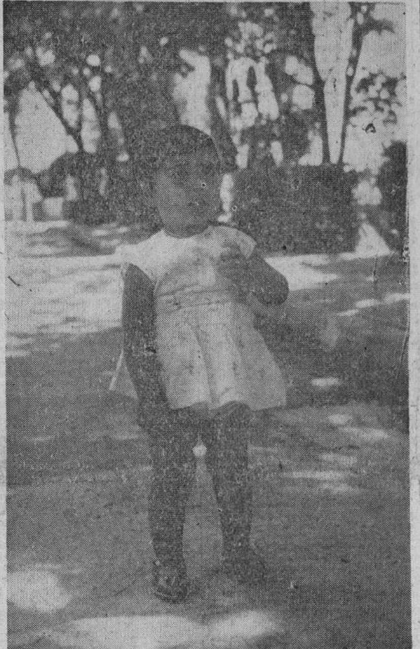
Abandonada en un portal

Palabras de Franco El Caudillo pronunció las siguientes palabras: "Felicito a todos los que han obtenido estos galardones en este día de exaltación del trabajo y del resurgimiento nacional. Habéis visto por las distintas facetas que representan los galardones concedidos, que todos los trabajos son dignos de respeto y de buena acogida. El trabajo se dignifica por el amor que se pone en él, y la empresa se dignifica también por la justicia, por la equidad y, sobre todo, por las relaciones humanas entre sus miembros.