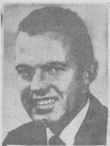
El comandante Leroy Gordon Co- oper, de 35 años de edad, próximo astronauta norteamericano, que pro- yecta dar 22 vueltas a la Tierra.

UN GRAN «PAJARO» ESPACIAL Mientras tanto, prosiguen las in- vestigaciones en diversos sentidos y el hombre va recopilando los datos ya experimentados. Durante una reciente reunión internacional celebrada en la sede de la Unesco, en París, sobre los problemas que se presentan al hombre en el espacio extraterrestre, se ha subrayado que no sufre ninguna limitación impor- tante de sus facultades al viajar a través de los espacios y que, por el contrario, se adapta fácilmente a las nuevas circunstancias. Puede aspi-