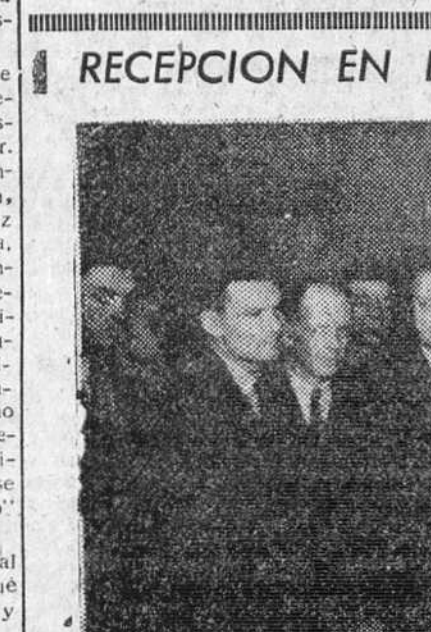
A MEDIODÍA DE AYER, EL AYUNTAMIENTO DE BURGOS OFRECIO UNA RECEPCION A LA DELEGACION PUGI ISTICA BELGA, ILEGADA A NUESTRA CIUDAD PARA ACTUAR EN LA GRAN VELADA INTERNACIONAL DE BOXEO QUE SE CELEBRARA MAÑANA EN LA PLAZA DE TOROS. — HE AQUI UN DETALLE DEL ACTO.