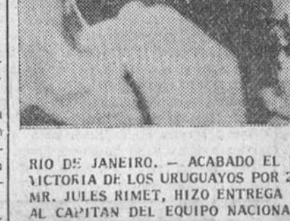
RIO DE JANEIRO. — ACABADO EL PARTIDO BRASIL-URUGUAY CON LA VICTORIA DE LOS URUGUAYOS POR 2-1. EL PRESIDENTE DE LA F. I. F. A. MR. JULES RIMET, HIZO ENTREGA DEL TROFEO QUE LLEVA SU NOMBRE AL CAPITAN DEL EQUIPO NACIONAL URUGUAYO.

AYUDA JUVENIL significa libros, escuelas, becas de estudio, orientación profesional... Acerca la cultura a aquellas muchachas españolas que no pueden costearse sus estudios.