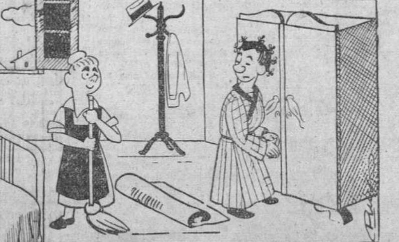
He perdido la llave de este armario ¿quieres traer el llavero a ver si puedo abrirle con alguna otra? --No se moleste, señorita. Ninguna sirve