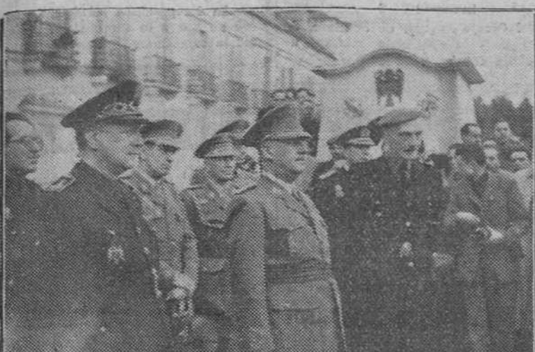
MADRID. -- SU EXCELENCIA EL JEFE DEL ESTADO RECIBIO EN EL PALACIO DE EL PARDO A LA PRIMERA PROMOCION DE JEFES DE CENTURIA DE LAS FALANGES JUVENILES, QUE LE HIZO ENTREGA DE UNA PANOPLIA CON EL GUION DEL CAUDILLO, EL ESCUDO DE NAVARRA Y LA ESPADA DE SANCHE EL FUERTE.