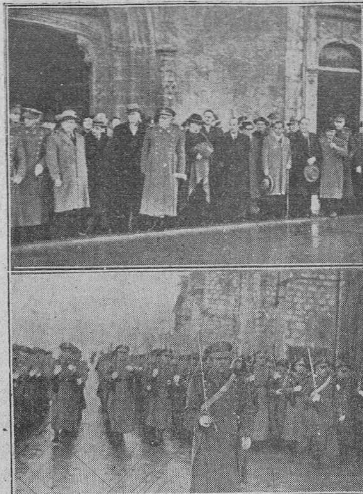
De la ceremonia religiosa celebrada ayer en la iglesia de la Merced, con motivo de la fiesta del Patrono de la Policía, recogemos en las precedentes fotografías dos momentos: arriba, las autoridades, en la sillería del templo y, en el plano inferior, las fuerzas de la Policía Armada, en el desfile.—(Fotós. FEDE)