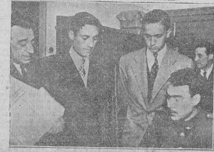
Zaragoza.—Los afamados novilleros Julio Aparicio y Miguel Baez "Litri", acompañados de dos oficiales de Aviación, mientras el sargento de Mayoría les rellena sus correspondientes filiaciones, con motivo de su ingreso como voluntarios en el Arma de Aviación, de guardia en esta plaza.