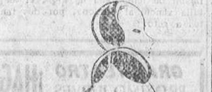
La línea de los abrigos de otoño, con cuello alto, mangas amplias y largo razonable, es de un innegable confort