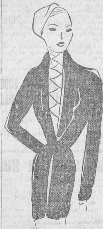
Chaqueta ceñida y larga, blusa de jersey, botas vasch, y ya está Ud. preparada para afrontar las lluvias de otoño