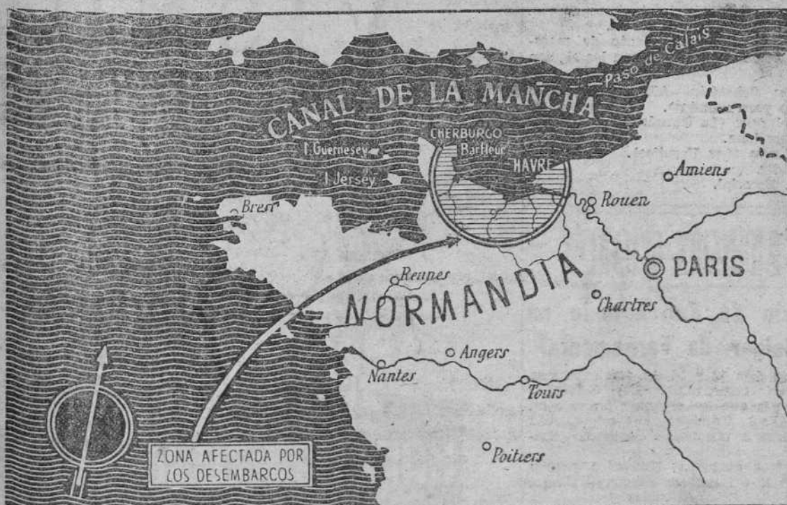
Dos zonas esenciales constituyen el centro de gravedad de los primeros desembarcos aliados en la costa francesa: el Orne y la península de Cotentin. He aquí un gráfico del escenario de los combates