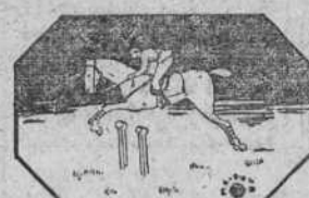
El impulso y el dominio exigen una perfecta coordinación nerviosa.