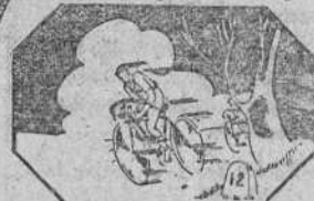
La velocidad exige un aparato muscular resistente y bien tonificado.