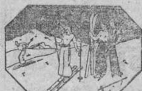
El equilibrio y la velocidad en las bajas temperaturas producen un mayor gasto de energía.

SUPER ALIMENTO VEGETAL DE ALTO PODER RECONSTITUYENTE Y NUTRITIVO