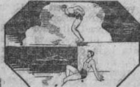
La elegancia de movimientos requiere una máxima elasticidad.