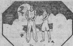
La agilidad y la rapidez de acción precisan una justa armonía entre músculos y nervios.