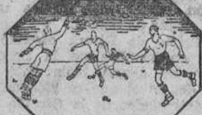
La precisión en los movimientos supone una concentración de todas las energías.