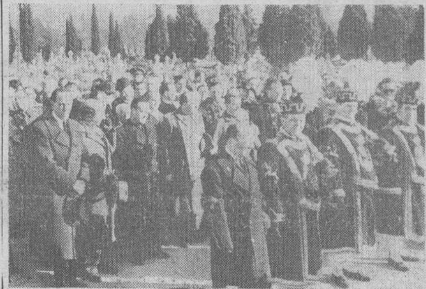
Un aspecto del entierro de las víctimas del hundimiento de la casa de la calle de Maldonado en Madrid