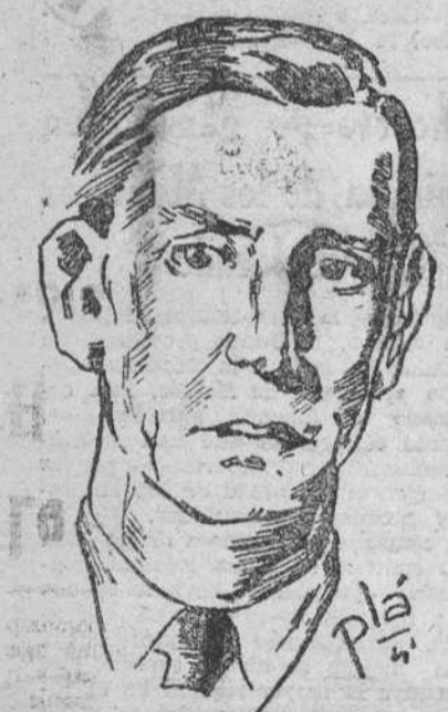
El vicealmirante del Aire, Eliott, comandante de las fuerzas aéreas aliadas en el próximo Oriente

El general Zervás héroe de la resistencia helénica Solónica meta final de una carrera de velocidad entre aliados