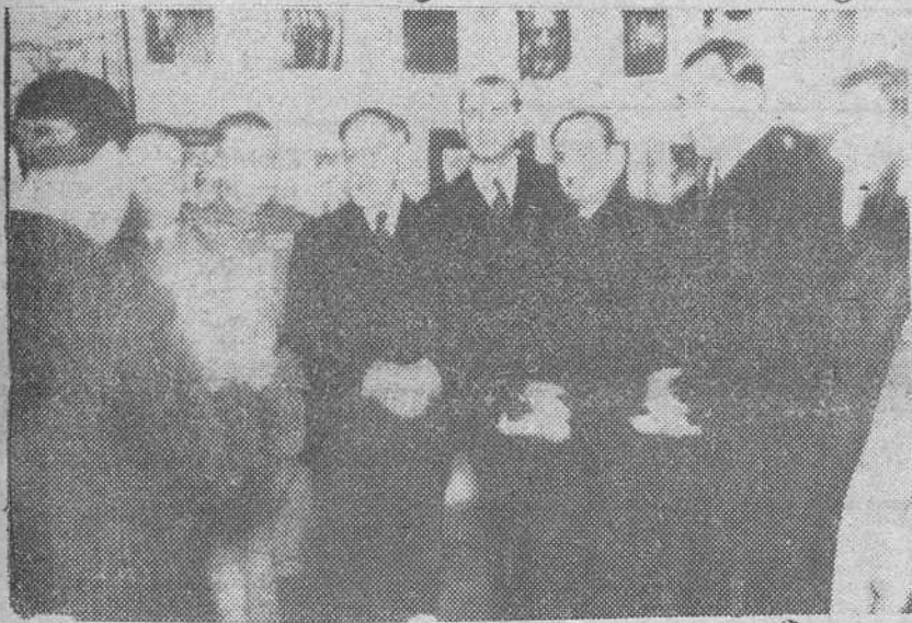
Los ministros secretario general del Movimiento y de Agricultura, camaradas José Luis de Arrese y Primo de Rivera, asisten a la inauguración de la Exposición de la Semana Santa malagueña que ha sido abierta en el Circulo de Bellas Artes de Madrid.