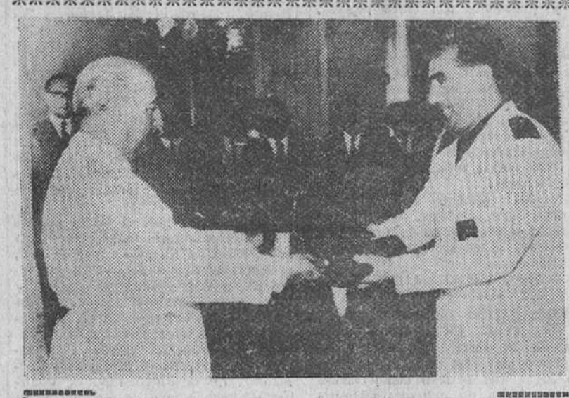
Audiencias del Jefe del Estado San Sebastián. — Su Excelencia el Jefe del Estado recibe una preciosa arqueta que le ofrece el Sindicato de Ganaderos.

Washington. — Un funcionario del Departamento de Estado, cuyo nombre no ha sido revelado, ha manifestado a un corresponsal de la United Press que, según opinión de dicho Departamento, la situación actual de las negociaciones que celebran en Madrid representantes de los Estados Unidos y de España, dista mucho de ser desesperada, agregando que todavía es demasiado pronto para decidir si las mismas darán o no resultado. Añadió que resulta ridículo insinuar que los negociadores españoles hayan planteado demandas que oficialmente sean consideradas absurdas, como se ha pretendido en la Prensa de Londres. Añaden los informantes que de la actitud adoptada por España se desprenden claramente que aquel país quiere ser puesto por los Estados Unidos a igual nivel que las naciones europeas de la NATO, lo cual explica sus demandas de armas, las cuales servirían para reequipar a su ejército y fuerzas aéreas, a cambio de bases aéreas y navales. Hacen observar, sin embargo, que la actual misión de los negociadores norteamericanos es la de explicar a sus interlocutores españoles, de modo exacto, qué armas se podrían poner a disposición de España en los próximos doce meses, así como las razones por las que no es actualmente posible las cantidades pedidas por las autoridades de Madrid.—Etc.