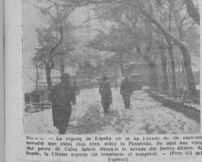
Madrid. — La capital de España no se ha librado de las copiosas nevadas que estos días ceden sobre la Península. He aquí una vista del paseo de Calve Sotelo durante la nevada del jueves último. Al fondo, la Cibelea soporta sin inmutarse el temporal. — (Foto GIL del Espinar)