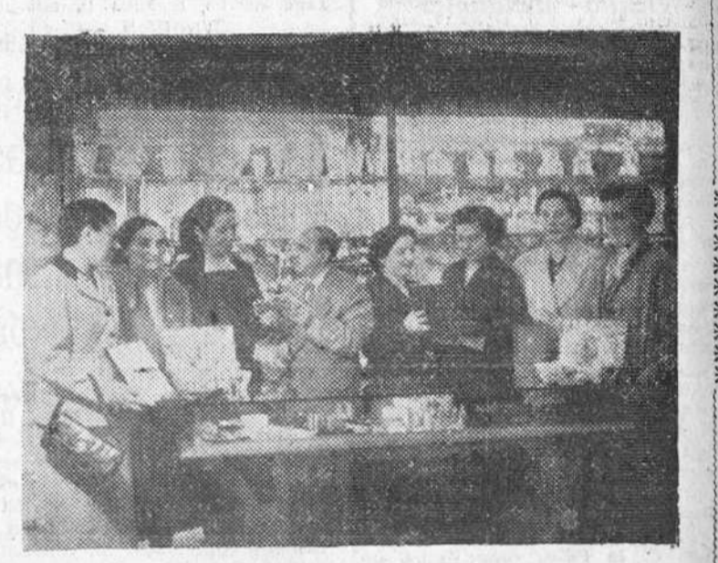
Reproducimos el momento de la entrega de premios por el señor Mariscal, en su establecimiento de Queipo de Llano, 7, a la agraciada con las 5.000 pesetas del primer premio y a las que lo fueron con los cinco siguientes