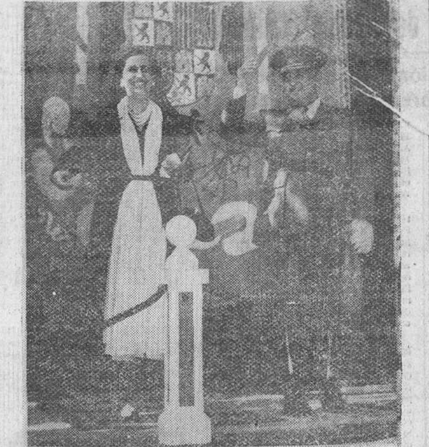
El Pardo. — S. E. el Jefe del Estado acompañado de su esposa corresponde a las manifestaciones de cariño que le hicieron objeto el grupo de generales, jefes y otras personalidades que acudieron al Pardo a felicitarle con motivo de su fiesta onomástica.