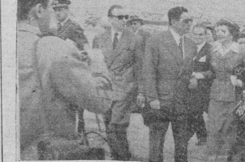
Madrid. — La famosa estrella del cine norteamericano, Claudette Colbert, fotografiada a su llegada al aeropuerto de Barajas.