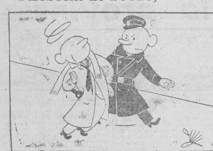
—La sociedad es cruel, señor guardia; van a imponerme una «pena» por estar «alegre».