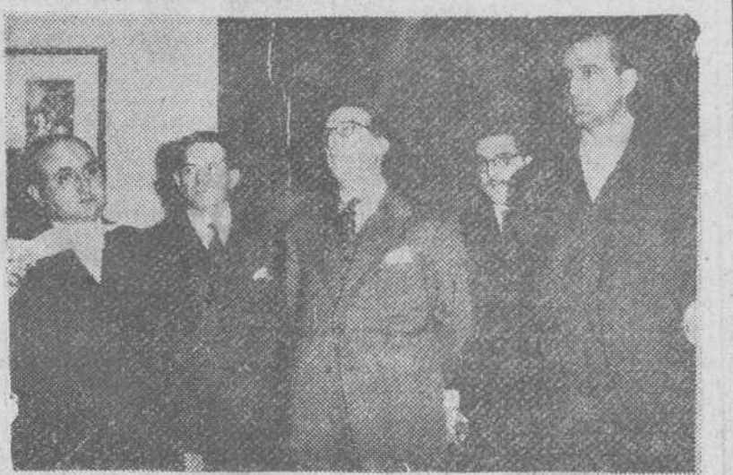
Madrid.— Los ministros de Información y Turismo y de Educación Nacional, con el director general de Prensa, en el acto de inauguración del Club de Prensa, fundado en la capital de España para los corresponsales extranjeros y periodistas españoles.