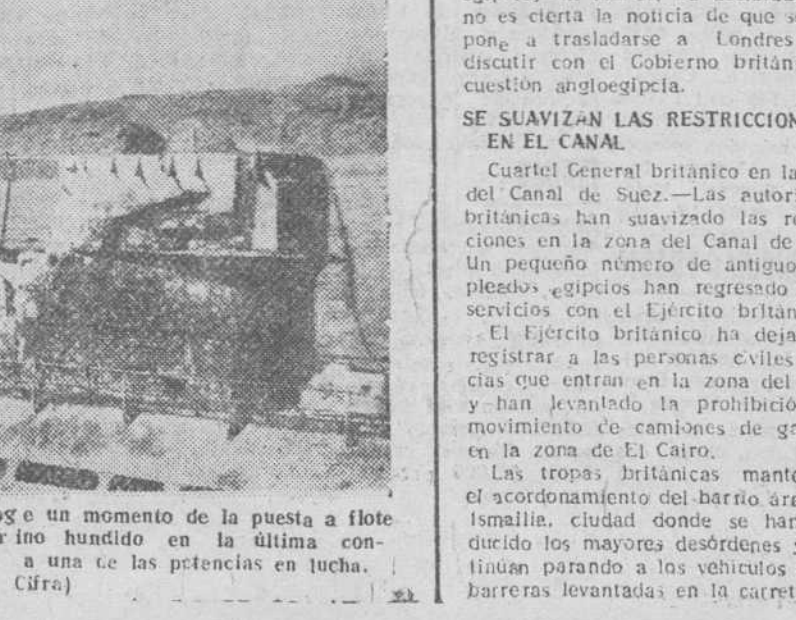
Las Palmas.— La fotografía recoge un momento de la puesta a flote en aguas canarias de un submarino hundido en la última contienda mundial, perteneciente a una de las potencias en lucha.