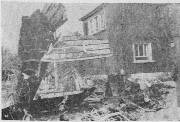
Las incursiones en territorio alemán se hacen cada vez más peligrosas para la aviación inglesa. He aquí los restos de uno de los aparatos derribados últimamente.