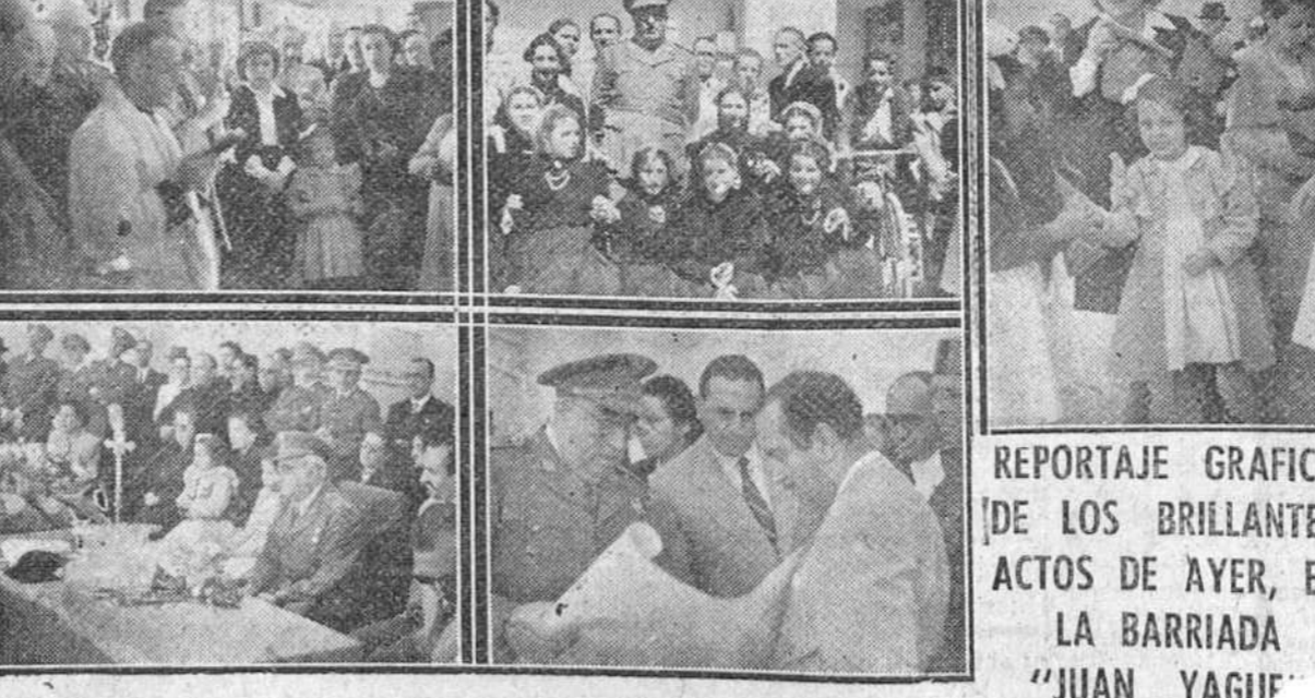
De izquierda a derecha: Bendición de las escuelas, el teniente general Yagüe rodeado por un grupo de niñas con trajes típicos, las hijas de nuestra primera autoridad militar entregando golosinas a un niño, un detalle de la presidencia de los actos y el insigne soldado mostrando al señor anteproyecto de la gran "Ciudad de los muchachos".—Foto FEDE

Filadelfia.—El presidente de la convención nacional republicana, Joseph Martin, que es a su vez presidente de la Cámara de Representantes y aspirante a la presidencia de los Estados Unidos, pronunció un discurso en dicha convención en el que dijo que en las próximas elecciones norteamericanas será elegido un presidente hacia el cual dirigirán su mirada todos los pueblos libres de la Tierra en busca de paz. Martin acusó al Gobierno demócrata de haber seguido una política vacilante en los asuntos internacionales y dijo que debido a esas vacilaciones de la Casa Blanca, el Congreso republicano se ha visto obligado a aprobar sumas enormes para la preparación militar. Manifestó Martin que el partido republicano debe restablecer el orden, la economía y la eficacia. Defendió también la actuación del Congreso que Truman ha criticado también y manifestó que desde que los republicanos conquistaron el control del Congreso, no encontraron más que obstrucción por parte del Poder Ejecutivo.—Efe