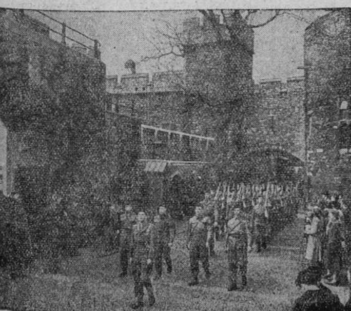
Una patrulla de las Reales fuerzas de Artillería británicas, entrando en la famosa torre de Londres para hacerse cargo de la guardia