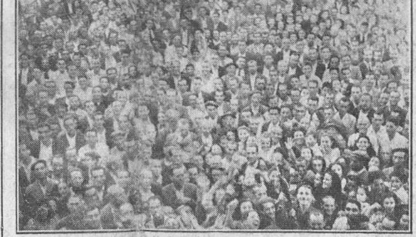
ALMADEN.—LOS MINEROS DE ALMADEN, CONGREGADOS FRENTE AL BALCON DEL AYUNTAMIENTO, PARA MOSTRAR SU ENTUSIASMO POR HABER SIDO APROBADA SU REGLAMENTACION LABORAL, ACLAMAN AL CAUDILLO Y A LOS MINISTROS DE HACIENDA Y DEL TRABAJO.