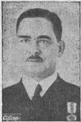
EL MINISTRO DE MARINA ALMIRANTE REGALADO

Sevilla.—El delegado de festejos ha facilitado el programa de actos que se celebrarán con ocasión de los