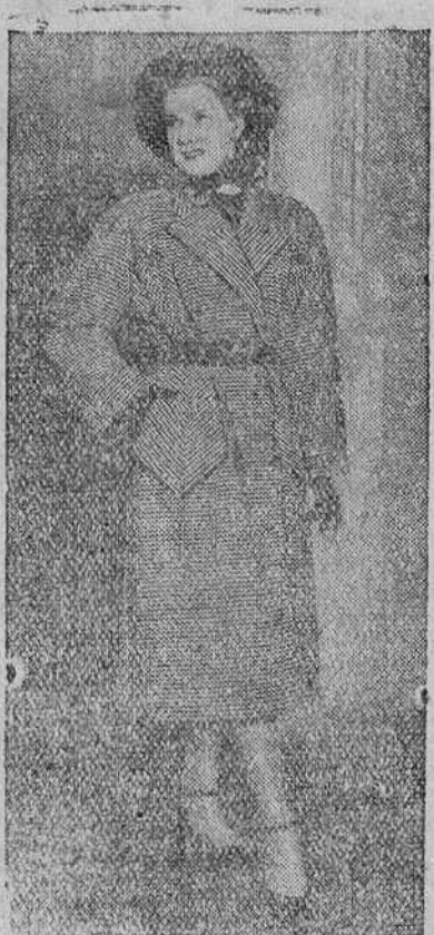
LONDRES.—MODELO DE ABRIGO DE ENTRETIMIENTO; TELA MITAD EN BLANCO Y NEGRO. ADORNOS DEL MISMO TEJIDO, QUE RESALTAN EN EL CONJUNTO POR SU PREPARACION EN FORMA DE ESPICILLAS.—Galpe