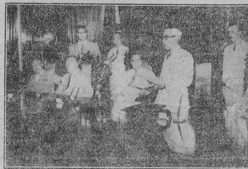
Madrid.—Don Teodoro de Aguilar Salas, ministro de España, pronunciando su discurso después del acto de ratificación del pacto de amistad hispano-filipino.