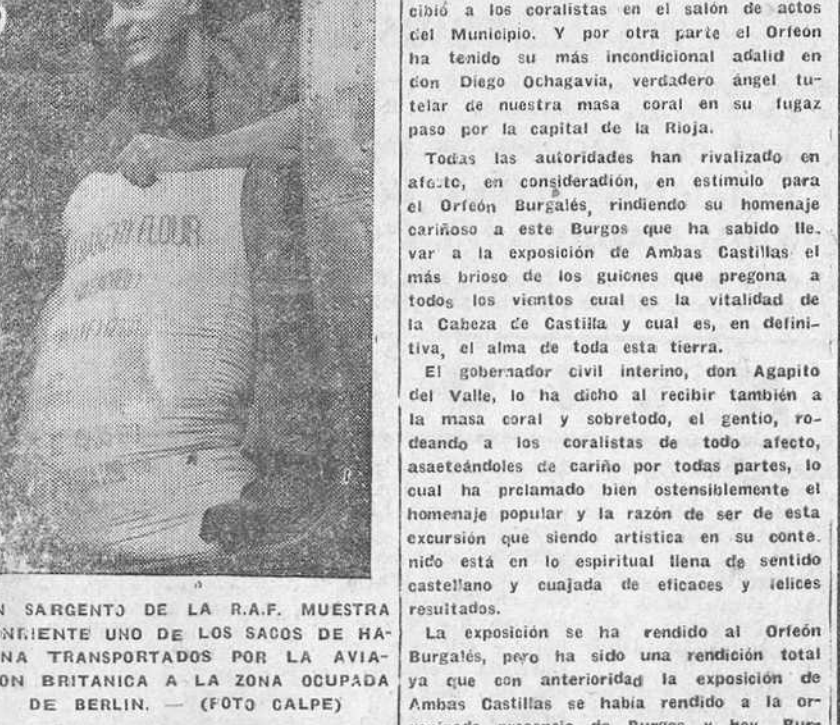
UN SARGENTO DE LA R.A.F. MUESTRA SENTIMIENTO UNO DE LOS SAJOS DE HARINA TRANSPORTADOS POR LA AVIACION BRITANICA A LA ZONA OCUPADA DE BERLIN.