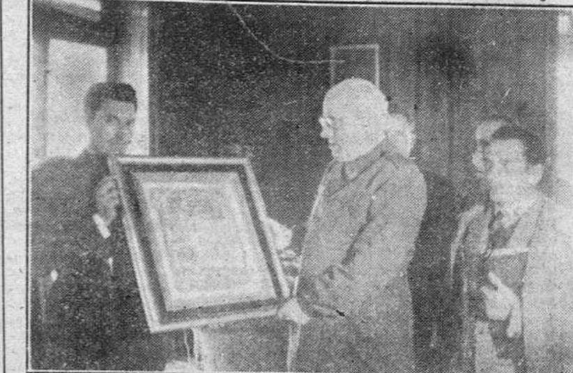
A mediodía de ayer, la Federación Burgalesa de Pelota, entregó al teniente general Yague, un artístico pergamino conteniendo el título de presidente honorario de dicha Federación. La foto recoge un momento del simpático acto, que con toda sencillez tuvo lugar en el despacho del ilustre capitán general de la VI Región.