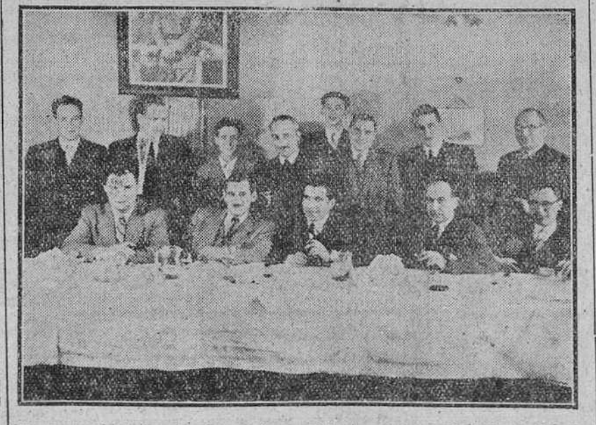
Un grupo de aseguradores burgaleses asistentes al banquete íntimo celebrado ayer con motivo de la conmemoración del "Día del Seguro".